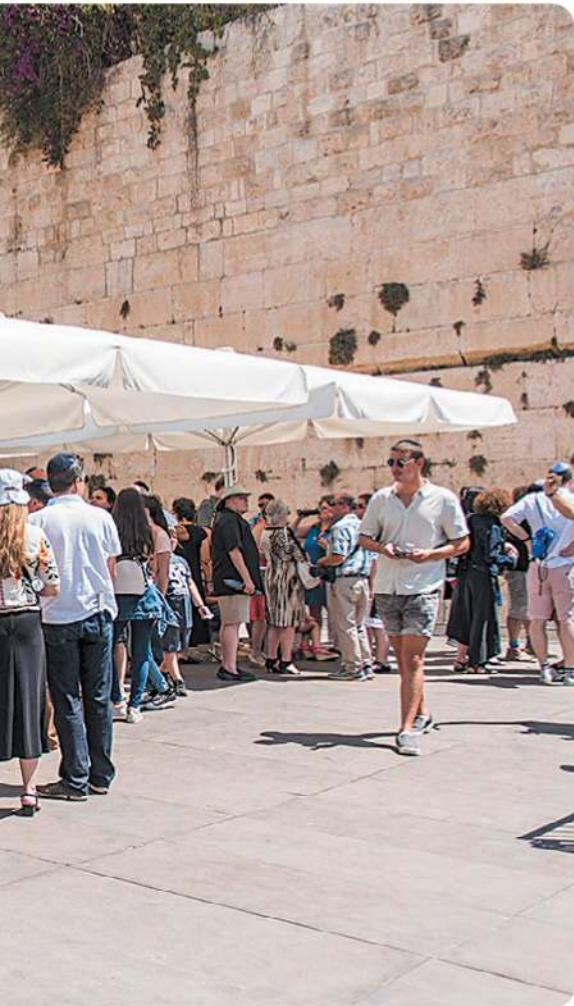
לא רק קונטרבטיבים ורפורמים באים לחגוג. משפחת גולן